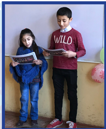
“Mən siniflə dost almağa qərar verdim...”

Gız övladımız dünyaya gəldikdən bir müddət sonra ona Kistoz fibroz diaqnozu qoyuldu. Bu diaqnozlu uşaqlar daim həkim müayinəsində olur və məhdud həyat tərzi keçirirlər. Onların boyu və çəkisi yaşidlərindən çox geri qalır, nitq problemləri olur, nəfəs almaqda çətinlik çəkir, buna görə də tez yorulurlar. Onlar yoldaşları kimi qaçıb oynaya bilmirlər. Əl barmaqları “baraban” effektlidir. Hər kəsə görə onlar bütün sağlam yaşidlərindən fərqlidirlər. Bu hal onların təhsil almasına potensial maneədir.